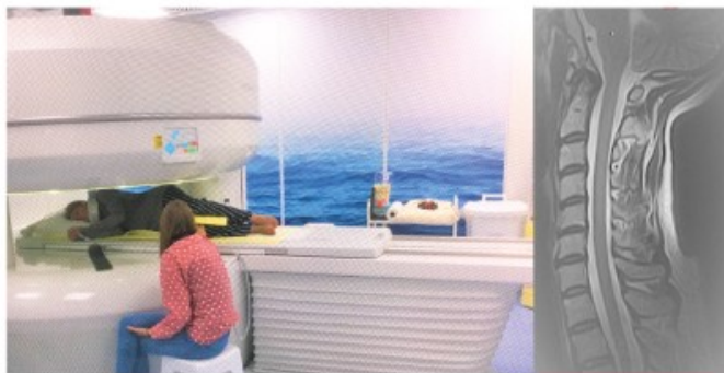
Ernstig claustrofobe patiënte in de open MRI in zijlig, begeleid door haar dochter.

Veel mensen durven niet in een buis, dus niet in een cilindrisch MRI systeem. Obese mensen kunnen vaak fysisch amper of helemaal niet in een buis. We beschikken over een open MRI scan 1,2 Tesla, het sterkste open MRI systeem op de markt. Het toestel is opzij over 270° open. In iedere positie is er zicht naar buiten en er is heel veel ruimte opzij van de patiënt. Tijdens het onderzoek kan de patiënt worden begeleid door familie, begeleider of door ons professioneel personeel.